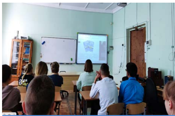
обучающиеся МБОУ ПРУДКОВСКАЯ СШ

Целью этих уроков являлось формирование у школьников, студентов и взрослого населения активной позиции по отношению к собственному здоровью и качеству товаров, вызвать интерес к улучшению качества жизни, а также активизации той деятельности, которая направлена на привлечение внимания к проблеме качества. Речь идет не только о безопасности товаров для человека и окружающей среды, но и о степени удовлетворенности запросов и ожиданий потребителей.