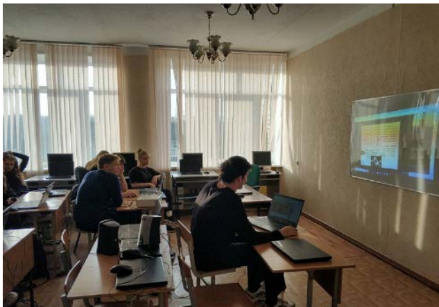
обучающиеся МБОУ ХОХЛОВСКАЯ СШ

Всего в образовательных мероприятиях приняло участие 628 слушателей.