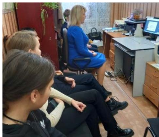
обучающиеся МБОУ КАСПЛЯНСКАЯ СШ